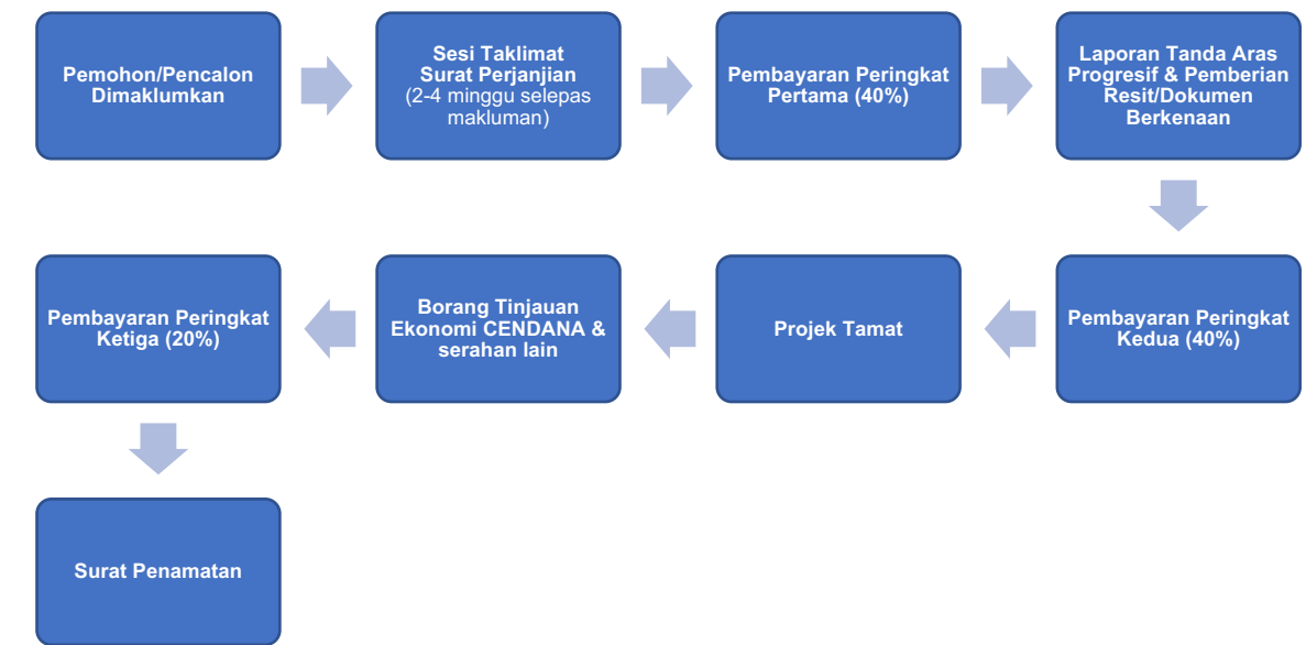
Struktur 3: Struktur pembayaran Program Pembiayaan Pemulihan Ruang Seni untuk jumlah pendanaan melebihi RM30,000 adalah seperti berikut: